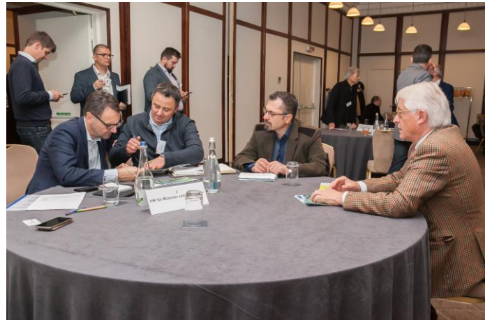
B2B-Gespräche von deutschen mit rumänischen Firmen in Bukarest

Ergänzt wird dies durch Logistik: Rumänien entwickelt sich zum regionalen Hub, Bulgarien zum Transitknotenpunkt zwischen Europa und Asien.